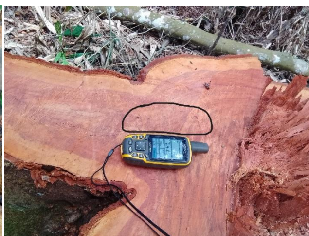
Photo 11 Souche de Sipo coupe en 2024

Coordonnées GPS : N 00,10336° E 019,38210°