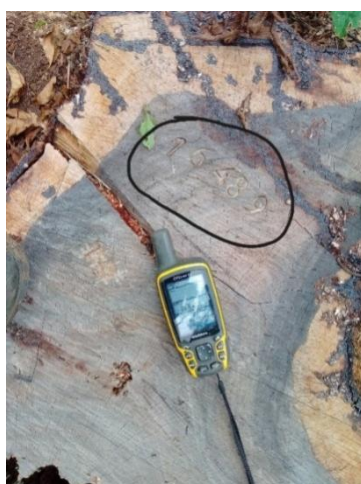
Photo 12 Souche Padouk coupe en 2023

L'équipe en mission a répertorié 17 souches coupées en 2023 et 2024 pour le compte de ces deux titres tel qu'énumérés dans le tableau 7. Le tous, numérotés aléatoirement à l'aide du marteau forestier. Au cours des échanges, le chef de chantier a renseigné que les numéros inscrits sur les souches permettent à l'équipe d'abattage d'associer chaque grume à sa souche et facilite les marquages sur les grumes. Et pourtant l'article 66 alinéa 1 de l'arrêté n°84 du 29 des bois d'œuvre prévoit : « Tout arbre après tronçonnage, reçoit un marquage. Sur les faces des grumes et des billes