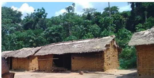
Photo 9 Maisons et Installations sanitaires des travailleurs

La COKIBAFODE loue pour le compte des titres 001/20 et 002/20, des maisons pour près de 105 travailleurs, dans un espace situé dans le village BEKONDJI, secteur de LUSANGANYA à BOLOMBA. Ces maisons sont construites en paille avec un point d'eau peu hygiénique, pas des points d'éclairages, des installations