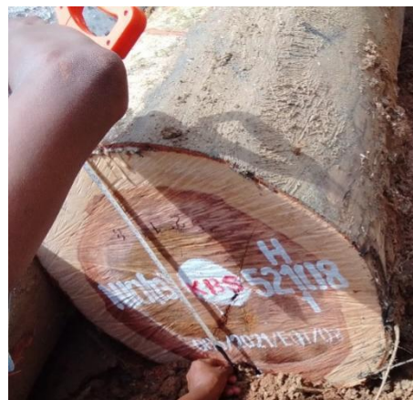
Photo 7 Grume de l'Essence NIOVE abattus à 55 cm de diamètre

En outre, lors du contrôle au port LOOLO de la COKIBAFODE à BOLOMBA, l'équipe en mission a également remarqué une grume de l'essence NIOVE marqué mesurant 55 cm de diamètre au lieu de 60 cm. Alors que l'article 15 alinéa 2 de l'arrêté n°028 du 07 Août 2008 fixant les modèles de contrat de concession d'exploitation des produits forestières et de cahiers de charges y afférent dispose : « Le DME est le diamètre au-dessous duquel l'exploitation d'une essence forestière est interdite ». En outre, il est interdit, conformément à l'article 64 alinéa 4 de l'arrêté n°84 du 29 Octobre 2016 portant conditions et règles d'exploitation des bois d'œuvre, l'abattage des arbres dont le diamètre est inférieur au DME ou DMA. L'exploitation en dessous du DME constitue une exploitation avec impact nocif sur l'environnement, elle ne permet pas à la forêt de maintenir sa capacité productive et ses fonctions écologiques et socio-économiques.