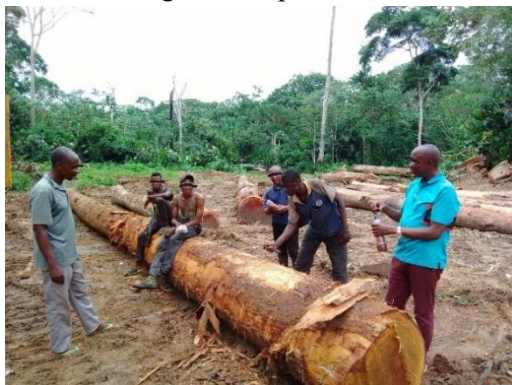
Photo 13 les 4 Travailleurs de la COKIBAFODE et 2 inspecteurs en mission

En forêt du titre concerné, l'équipe en mission a observé l'équipe des travailleurs en plein service sans les EPI (combinaison, gants de protection et les bottes). Au cours des échanges, les travailleurs ont renseigné que les