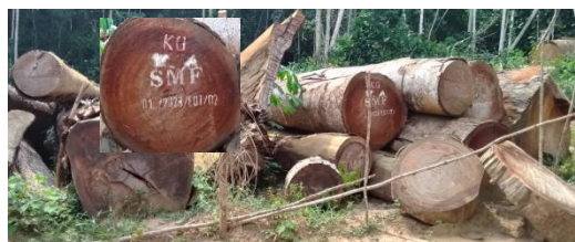
Photo 15 Grumes bloquées à MBUYA marquant le sigle de l'exploitant à la peinture

Pendant la descente en forêt du chantier MBUYA à ITIPO, l'équipe en mission a observé au village MBUYA (S 00.87423° E 018.58557°) 56 grumes dont 27 portaient le sigle de l'exploitant marqué en peinture (14 Padouk, 9 KOSSIPO, 2 BOSSE, 1 TIAMA et 1 TALI). Et 19 portant aucune marque. Toutes ces grumes étaient bloquées dans le parc à bois à MBUYA suite au conflit des communautés qui disputaient la propriété de cette forêt.