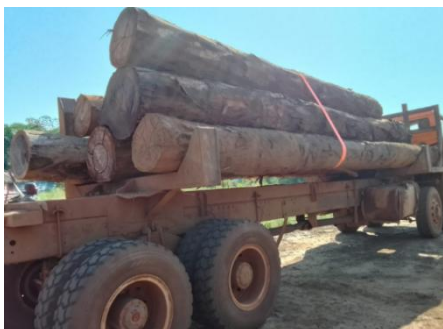
Photo 1 Véhicules transportant 7 Padouk non marqués pour le pont

Coordonnées GPS : S 00,31744° E 018,97597°