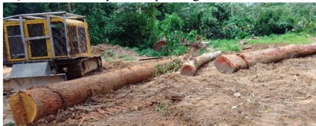
PHOTO 3 Photo 4 BILINGA coupée et tirée fraîchement de la forêt

et 2024, elle n'a pas prolongé l'ancien ni sollicité un nouveau permis. Au cours des échanges, elle avait renseigné que dans ce titre elle était seulement en train d'évacuer les bois coupés en 2023.