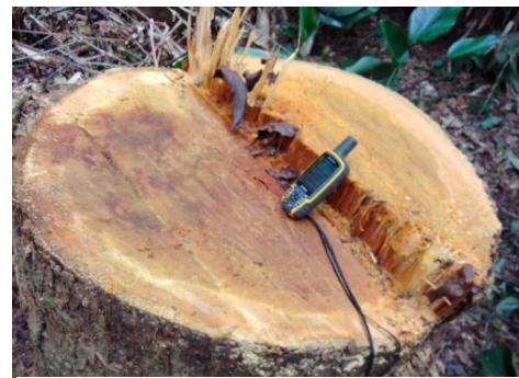
Photo 2 Souche de BILINGA coupées fraîchement

L'OI considère que la société exploite dans ce titre en 2024 sans permis en violation des dispositions évoquées. Elle est donc passible d'une peine de servitude pénale d'un mois à trois ans et/ou d'une amende de 10.000 à 500.000 FC constants (article 147 alinéa 4 CF). Par conséquent il recommande au directeur de la CCV, sans préjudice des autres sanctions prévues, d'ouvrir et suivre ce contentieux en vue de sanctionner la société.