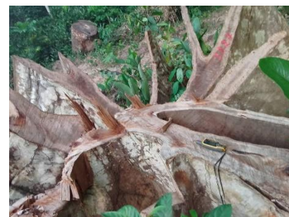
Coordonnées GPS : S 00.87483° E 018.58640°

La SOMIFOR n'a pas présenté pendant le contrôle documentaire à l'équipe en mission le programme de formation continue ou de perfectionnement de son personnel. Alors que le modèle de coupes observées sur terrain par ses abatteurs ne respecte pas les normes EFIR. Les abatteurs coupent les arbres en détruisant les racines et Cela ne favorise pas la régénération des essences. Nécessitant de ce fait une formation des travailleurs en vue de perfectionner leur travail. Il est établie que le concessionnaire doit élaborer un programme de formation continue ou de perfectionnement dans les domaines de