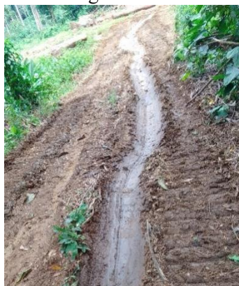
Photo 5 La trace de bois tiré ramenant l'équipe en mission vers les souches

13 grumes des essences PADOUK (9) ET BILINGA(4). Parmi lesquelles 7 non marqués et 1 venant d'être coupé et tiré fraîchement. Après échange avec cette équipe qui niait le fait, l'équipe a suivi la trace des bois tirés pour atteindre les souches fraîchement coupés. Alors qu'il est établi qu'avant toute activité de l'exploitation, le concessionnaire doit obtenir de l'administration forestière une autorisation annuelle de coupe valable pour une année allant du 1 er Janvier au 31 décembre qui peut être prolongé d'une ou deux années 6 .