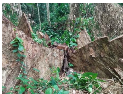
Photo 14 2 Souches de PADOUK coupées sans respect des normes EFIR

Coordonnées GPS : S 00.87605° E 018.58588°