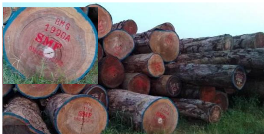
Photo 16 Grumes au Parc Beach marquant le sigle de l'exploitant en peinture

Coordonnées GPS : S 00.87423° E 018.58557°