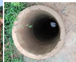
Photo 8 Puit d'eau

Coordonnées GPS : S 00. 03524° E 019. 28941°