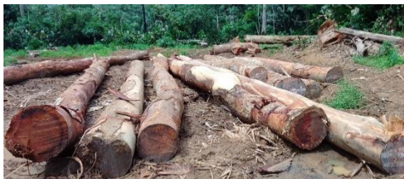
PHOTO 6 les grumes des essences coupés en 2024 sans permis

Pour ce titre 002/20, la société a obtenu le permis n°005/2021/EQT/03 en 2021 qui a été prolongé en 2022. En 2023