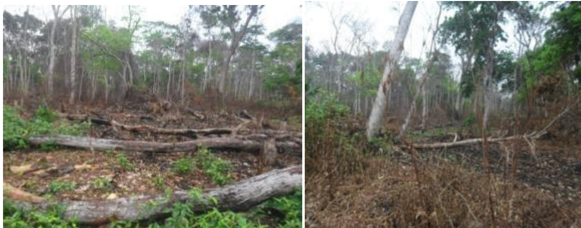
Photo 7 : Surface forestière brûlée pour contester la présence d'ERA

Il existe des conflits de limites avec un village voisin.